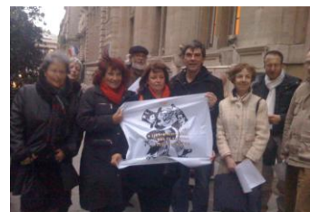
Les JNVP devant la mairie du 11 e . 23 Mars 2009