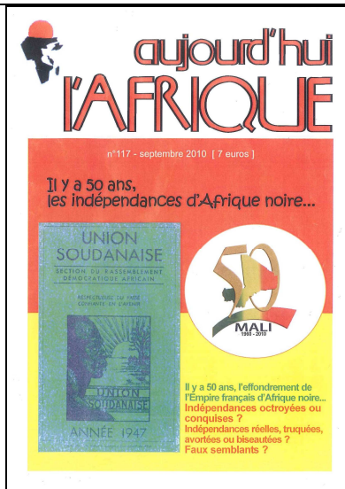
Numéro spécial de notre revue (47 pages)