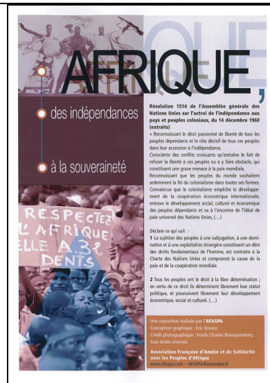
Exposition composée de 12 panneaux

Le verre de l'Amitié sous toutes ses formes :