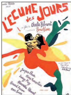
L'ÉCUME DES JOURS