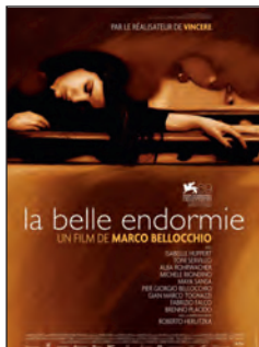
LA BELLE ENDORMIE