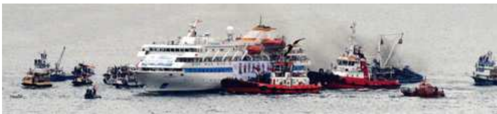
Le bateau civil humanitaire Mavi Marmara le 31 mai 2010, victime de l'assaut israélien

Que s'est-il passé ? Qui sont ces militants pro-Palestiniens ? Quelles étaient leurs motivations ? Et pourquoi ont-ils tenté encore à partir vers la même destination, fin juin 2011, plus nombreux encore, plus déterminés, malgré les menaces du gouvernement israélien ?