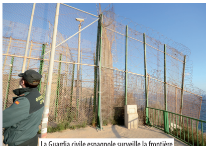
La Guardia civile espagnole surveille la frontière hispano-marocaine à Melilla, enclave espagnole située au Maroc – Mars 2012.

En Europe, la mise en place de l'espace Schengen, à la fin des années 1980, a conduit à un effacement progressif des contrôles frontaliers entre les états membres tandis que le contrôle de la frontière européenne extérieure se renforçait. Ce processus s'est traduit par un transfert des contrôles des migrants à des pays périphériques ou limitrophes. Ce processus s'est d'abord opéré au Sud, sur les côtes méditerranéennes maghrébines, dans les années 2000, avant de s'étendre à l'Est, dès 2004. Parfois, ce travail est délégué à des entreprises privées. Les premières victimes restent toujours les migrants, confrontés à la violence et à la répression.