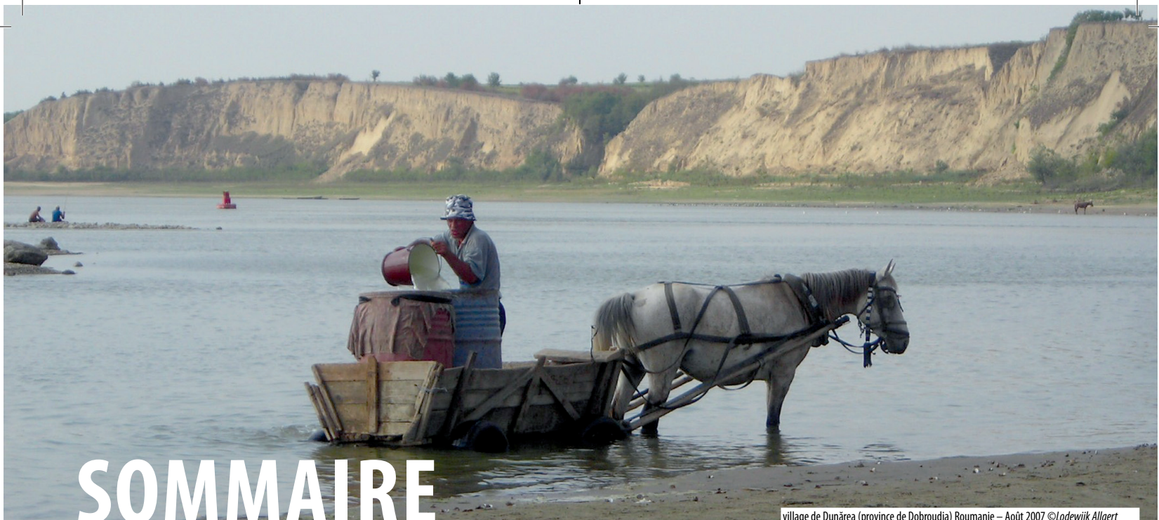
village de Dunărea (province de Dobroudja) Roumanie – Août 2007