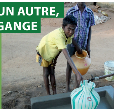
Enfants se servant pour la première fois du robinet, juste rénové. Village de Seepalakottai – Inde. Automne 2011.

Les 2€ de la solidarité récoltés pendant la 11 e édition du festival de l'Oh ! ont permis