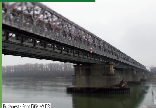
Budapest - Pont Eiffel

Le Danube est à la fois frontière et ressource commune. La question de sa gestion à l'échelle globale est aujourd'hui un enjeu majeur pour prévenir les risques environnementaux. Des programmes transnationaux de préservation des rives sont aujourd'hui expérimentés. A ce titre, l'exemple danubien pourrait être un modèle pour d'autres processus de coopération fluviale.