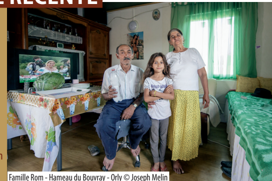
Famille Rom - Hameau du Bouvray - Orly

22 ans après la chute des régimes communistes, que sont devenus les millions de Roms qui habitaient ces pays - Bulgarie, Roumanie notamment ? La période post-communiste a profondément ébranlé les modes de vie hérités des générations précédentes. L'irruption du libéralisme a tracé des chemins que certains ont suivis, en devenant d'excellents entrepreneurs par exemple. Nombre d'entre eux se sont accommodés au nouveau système et ont grossi les rangs de la classe moyenne, déjà établie