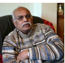
Abdul Gaffar Chowdhury