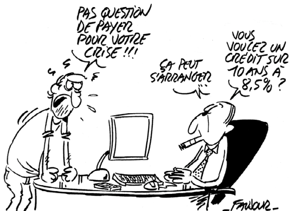
Faujour - Iconovox