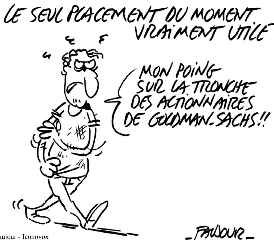
Faujour - Iconovox

majorité de la population : fiscalité injuste pour compenser (TVA dont le taux réduit augmente aujourd'hui de 5,5 à 7 % avec le plan Fillon, impôts locaux) et politiques d'austérité pour rembourser la dette.