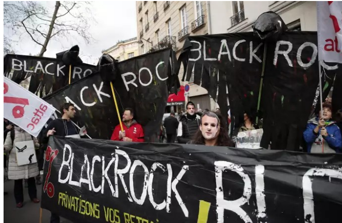
BlackRock et l'épargne retraite en France : un marché potentiel conséquent

Après avoir visionné ensemble un documentaire sur BlackRock *, nous échangerons avec Dominique Plihon , membre du conseil scientifique d' Attac et des économistes atterrés, sur la capitalisation rampante du système de retraite que porte le projet de réforme et, bien sûr, sur l' évolution du mouvement après les manifestations nationales du 9 et 11 janvier.